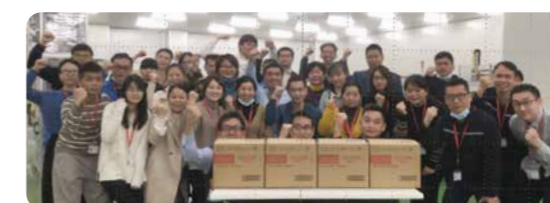
初回製造時のスタッフ