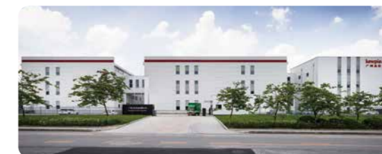
広州丘比食品有限公司