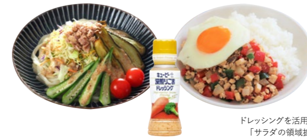
ドレッシングを活用した 「サラダの領域拡大」

生野菜のサラダだけではなく、蒸す・煮る・炒めるなど様々な野菜の食べ方を提案していくことを「サラダの領域拡大」として、取り組みを進めています。野菜をおいしくたくさん召し上がっていただくことを通じて、健康に貢献していきます。