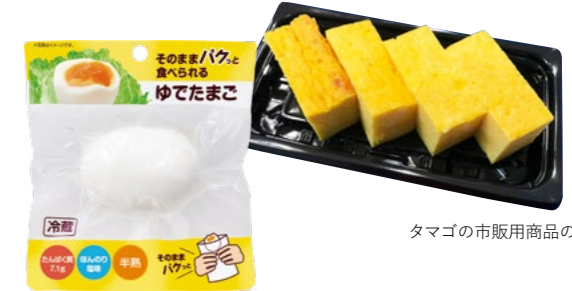
タマゴの市販用商品の創出

これまでは、業務用市場を中心に卵の特性、機能を活かした商品を数多く展開してきましたが、これからは栄養価の高い卵を、お客様により身近で手軽においしく召し上がっていただけるよう、市販用でのタマゴ加工品の展開を強化していきます。