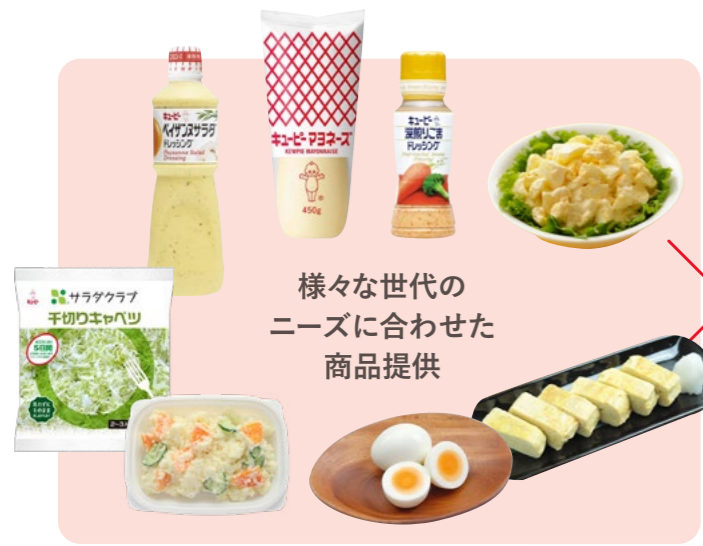
様々な世代の ニーズに合わせた 商品提供

のサラダとタマゴの組み合わせは栄養バランスの面でも、食事のおいしさの面でも、彩りの面でも、申し分ないものと考えています。「サラダとタマゴの世界を磨き上げるにより、おいしくたくさん食べることを実現する。」これがまさに健康の証であり、世界の方々の健康の維持向上をめざしていきます。