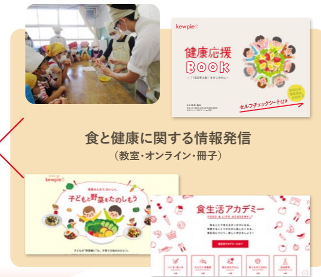
食と健康に関する情報発信 (教室・オンライン・冊子)